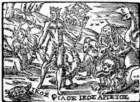
Fig. 1 Aneau Barthélemy, Picta Poesis . Emb., « Tecum Habita ».

Añadíamos como explicación que Borja se había visto un tanto forzado a realizar este cambio porque Aneau había delimitado en exceso el uso simbólico de la tortuga al volverla modelo de la mujer virtuosa en su Décades de la description des animaux, forme et vertu naturelle