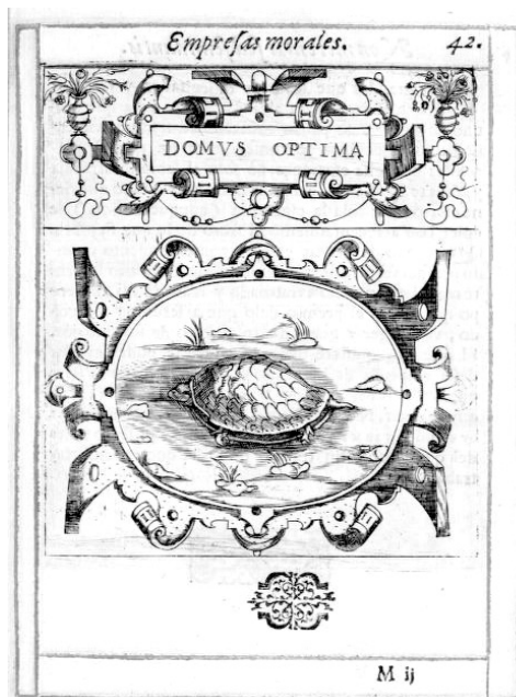
Fig. 3 Juan de Borja, Empresas Morales . Empresa XLI.